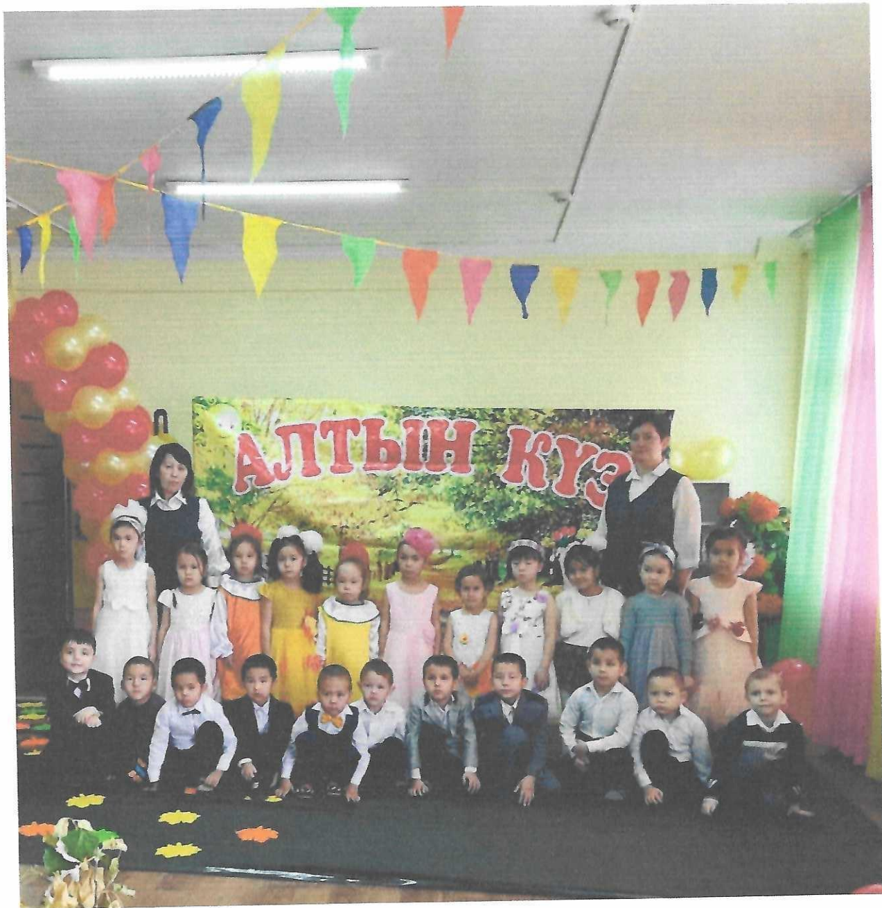
«Алтын күз» тақырыбында ашық оқу қызметін көрсетіп, іс-тәжірибиімен бөлістім.